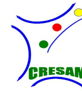
CRESAM Centre National de Ressources pour enfants et adultes sourdaveugles et sourds malvoyants